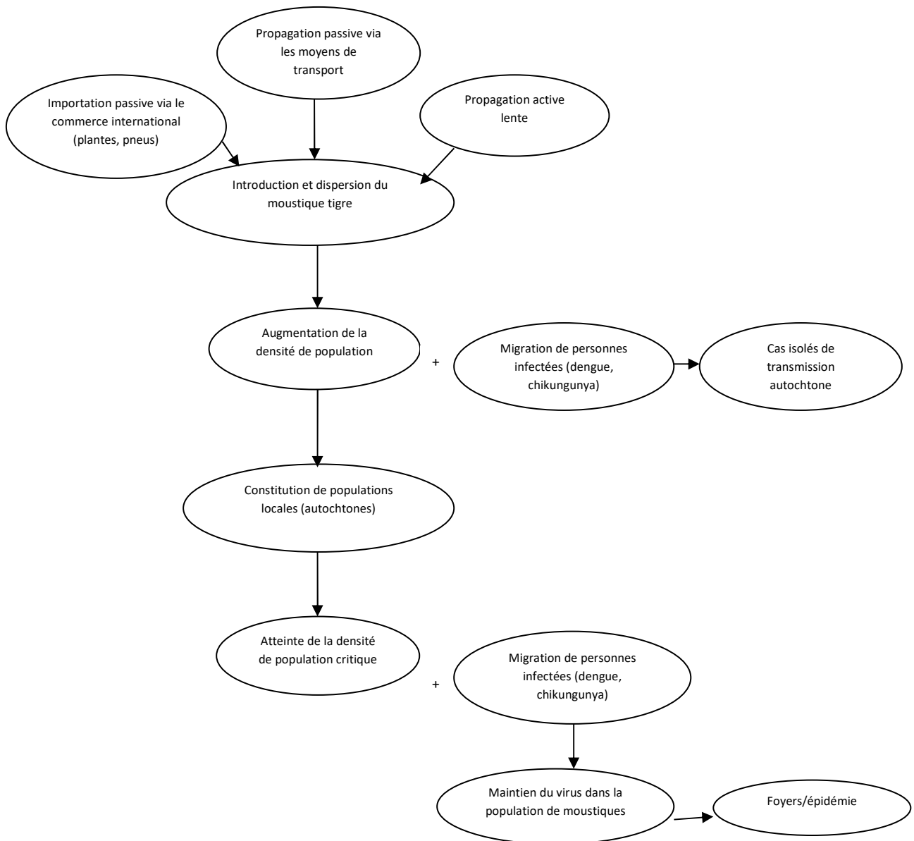
Figure 1: facteurs pouvant conduire à des épidémies de virus transmis par le moustique tigre